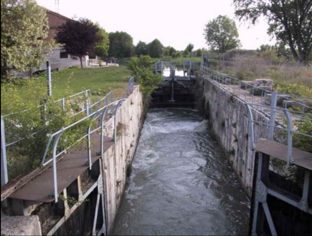
Salida desde Valladolid